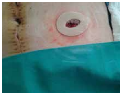
Figura 4. Durante el ingreso: disco moldeable Coloplast Brava®