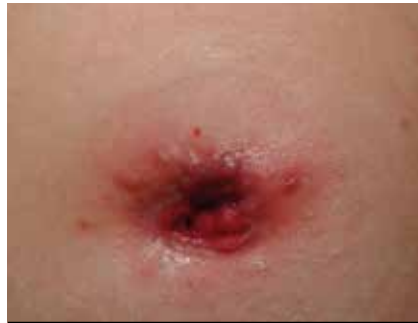
Figura 9. Cuidados domiciliarios y en Consulta de Estomatoterapia: estenosis del estoma e integridad de la piel pericostómica