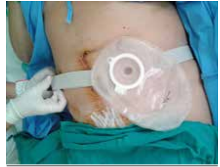
Figura 7. Durante el ingreso: colocación de cinturón