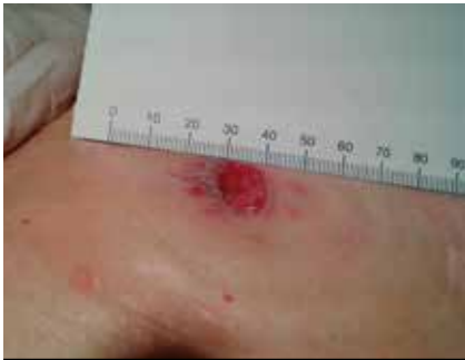
Figura 8. Cuidados domiciliarios y en Consulta de Estomatoterapia: medición del estoma (10 mm de diámetro)