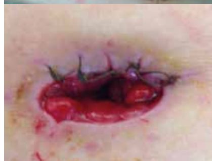
Figuras 1 y 2. Durante el ingreso: retracción del estoma