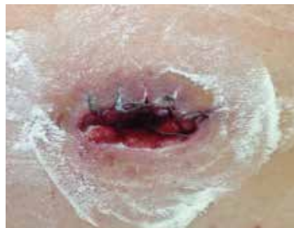
Figura 3. Durante el ingreso: polvos hidrocoloides Coloplast Brava®